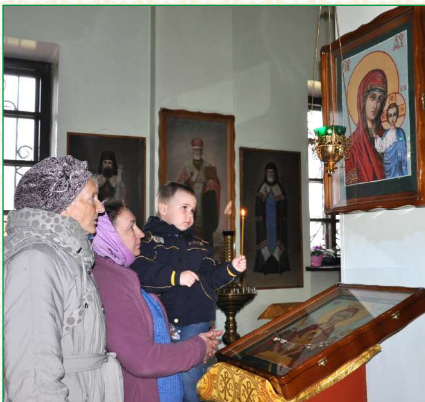
Икона «Казанской» Божьей Матери

Иконе, написанной О. Г. Петровой, прихожане храма приносят свои молитвы уже больше 15 лет. Богоугодное дело продолжает служить всем кто просит помощи у Матери Божией.