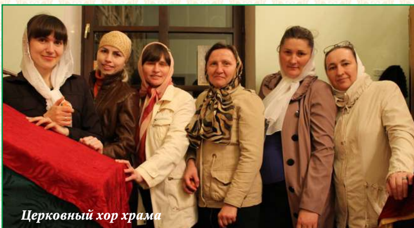
Церковный хор храма

По благославлению настоятеля храма учащиеся группы воскресного дня участвуют в богослужении: девочки поют на клиросе, мальчики помогают в алтаре.