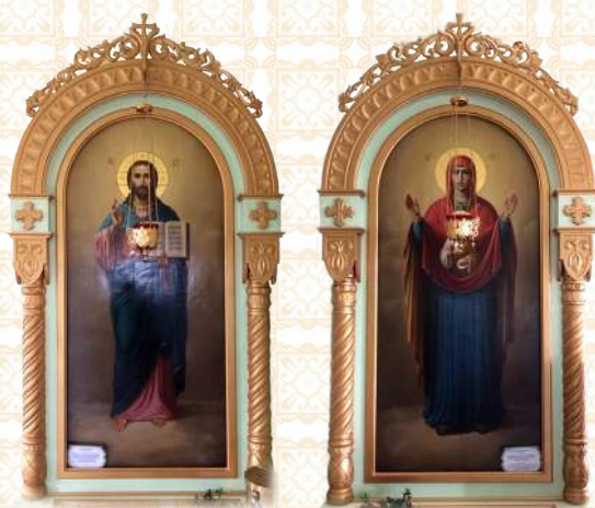
Иконы «Спасителя» и «Божьей Матери» из Покровского собора города Воронежа

В храме находятся иконы святителей Луки (Войно-Ясенецкого) Симферопольского и Иоасафа (Лоренко) Белгородского с частицами их мощей, иконы «Божьей Матери», «Спасителя» и Деисус из Покровского собора города Воронежа. Старые, намоленные, они не просто украшают собой помещение, а словно дают храму новые силы.