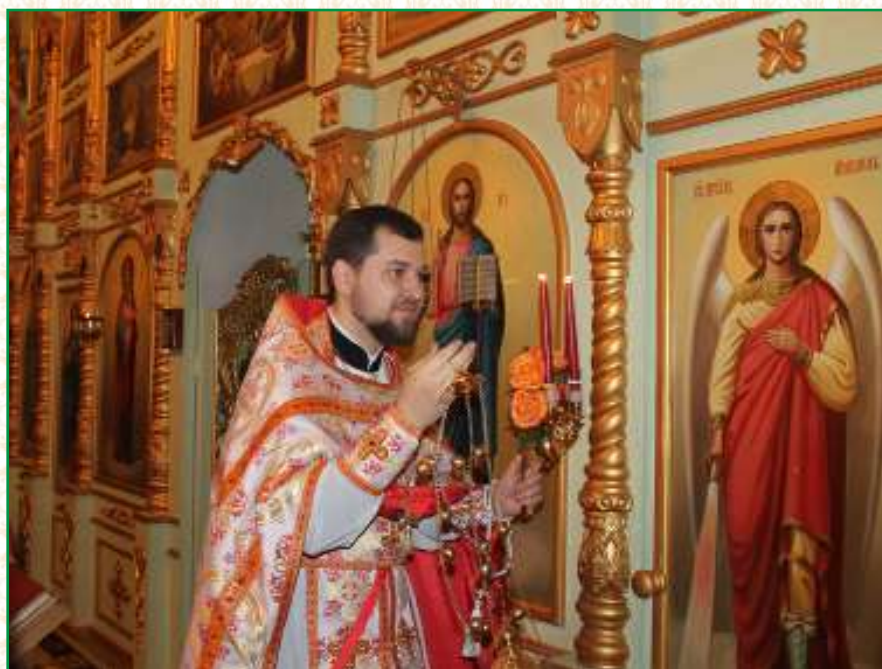
Пасхальное Богослужение. 16 апреля 2017 г.