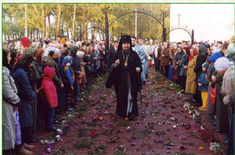
22 сентября 2002 года – визит архиепископа Белгородского и Старооскольского Иоанна