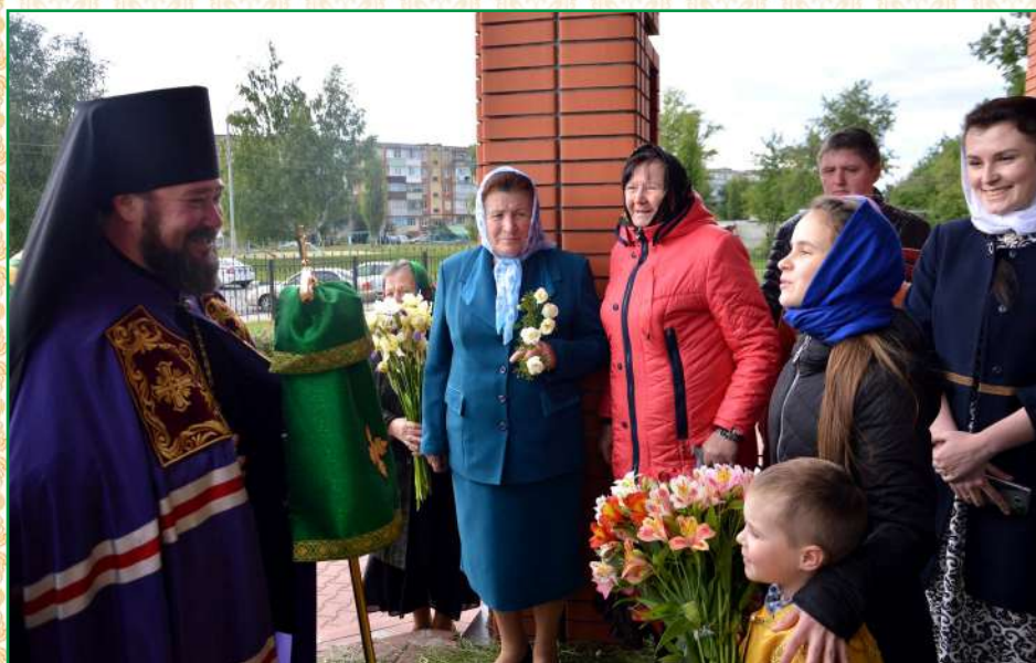
Праздничное всенощное бдение с участием правящего архиерея. 3 июня 2017 г.