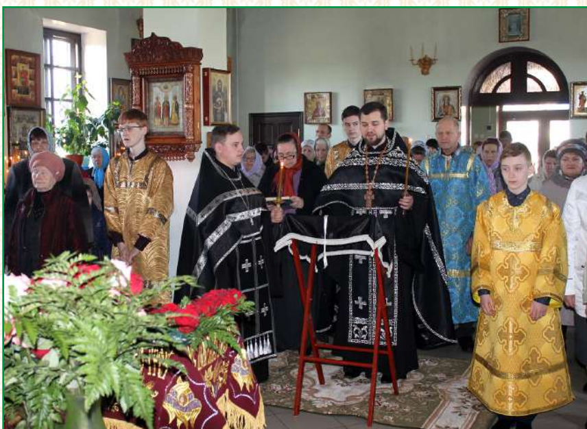
Великая пятница в Свято-Троицком храме. 14 апреля 2017 г.