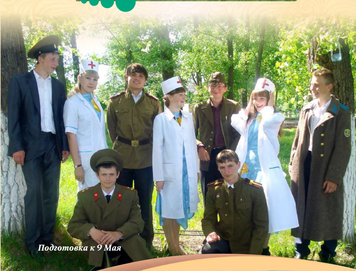
Подготовка к 9 Мая