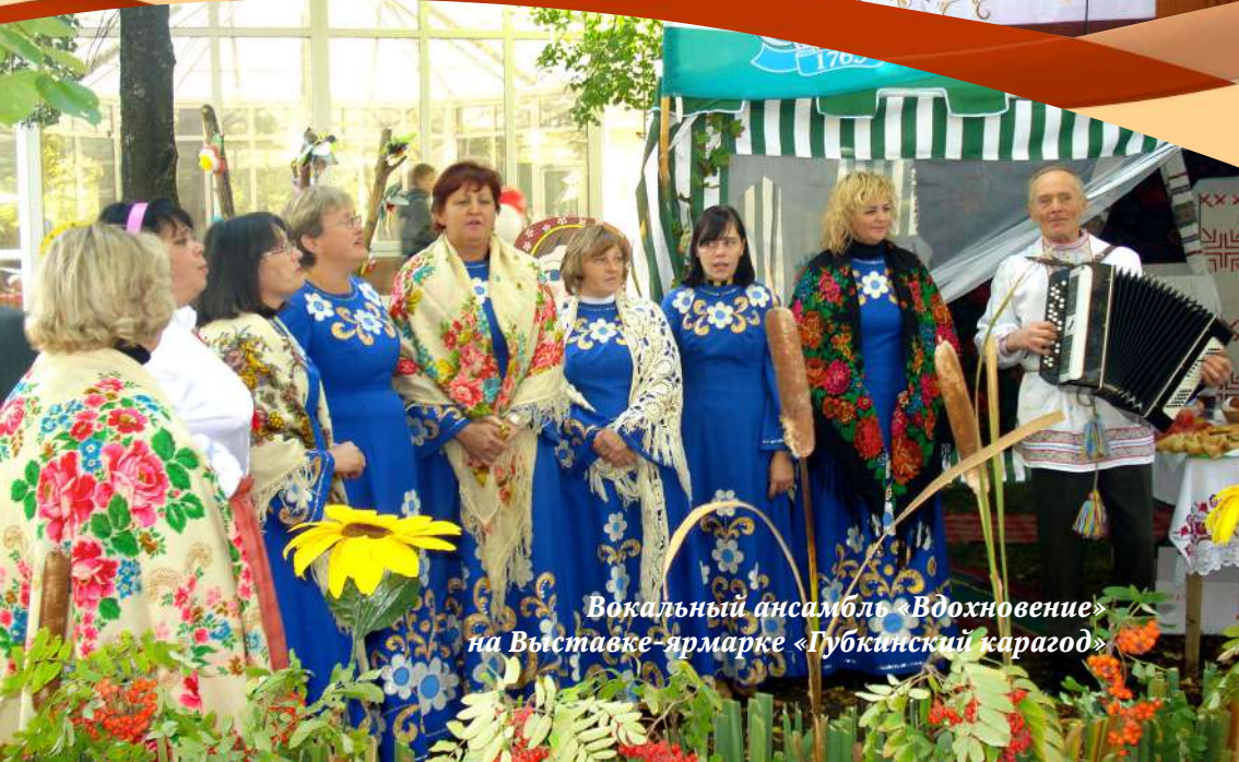
Вокальный ансамбль «Вдохновение» на Выставке-ярмарке «Губкинский карагод»