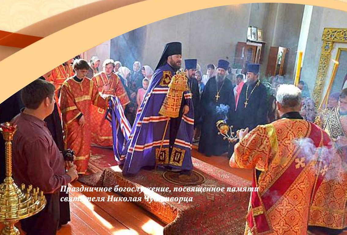
Праздничное богослужение, посвященное памяти святителя Николая Чудотворца