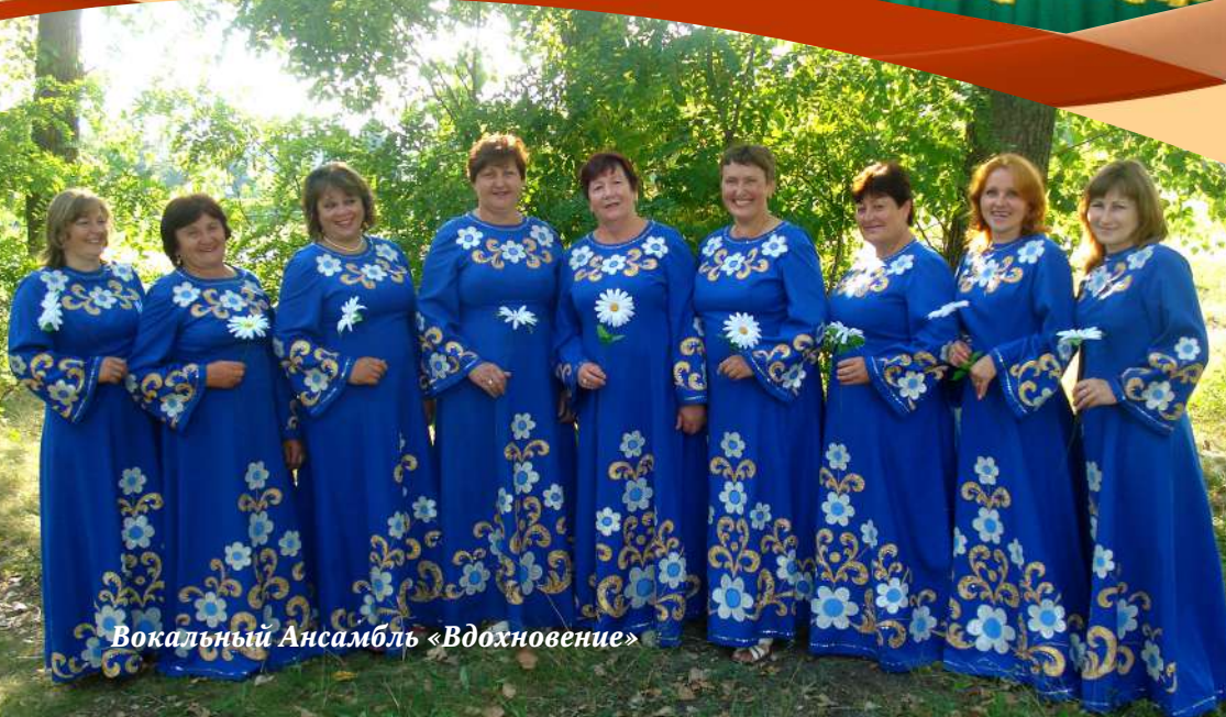
Вокальный Ансамбль «Вдохновение»