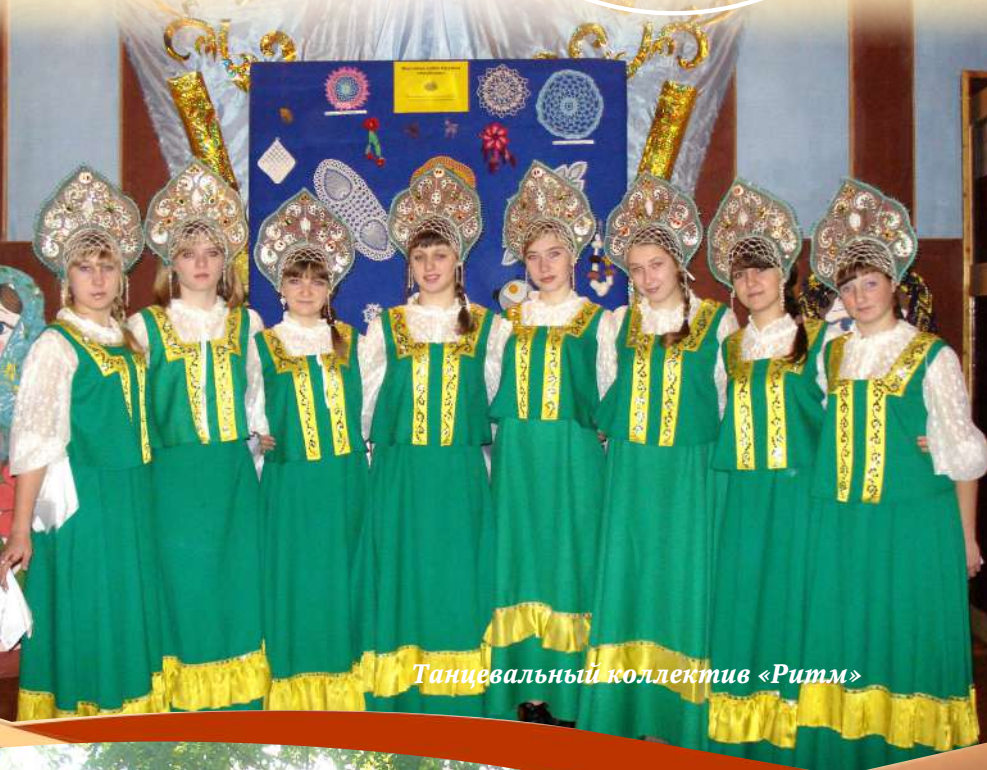
Танцевальный коллектив «Ритм»

В Доме культуры функционируют вокальный ансамбль «Вдохновение», фольклорный ансамбль «Задоринка», детский вокальный ансамбль «Капельки», танцевальный коллектив «Радуга», театральный коллектив «Теремок», кукольный театр «Солнышко»; кружок декоративно – прикладного творчества «Клубочек».