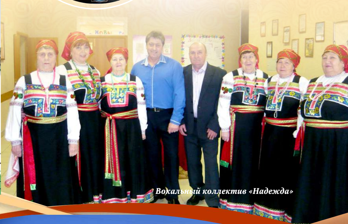
Вокальный коллектив «Надежда»