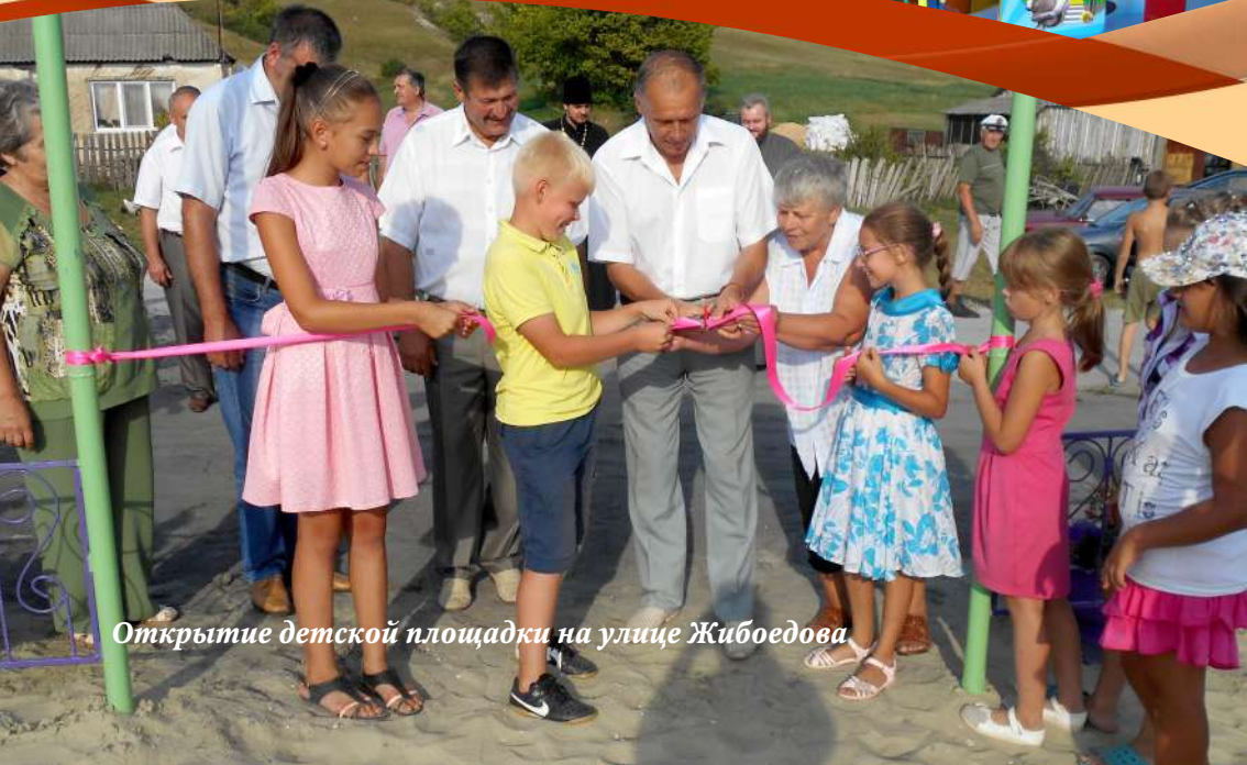
Открытие детской площадки на улице Жибоедова