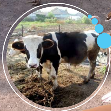
Фермер Ю.Ф. Переверзев

Во дворе Юрия Федоровича немало разной птицы: куры, утки и цесарки, индюки. На заднем дворе расположились лобастые бычки.