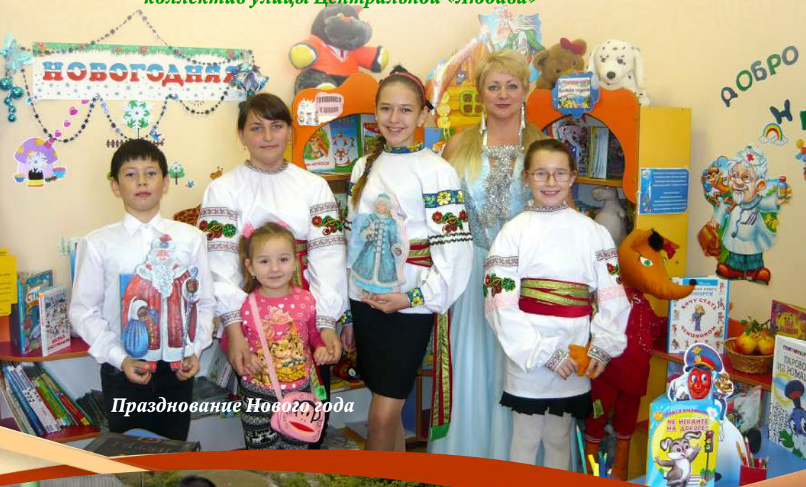
Празднование Нового года