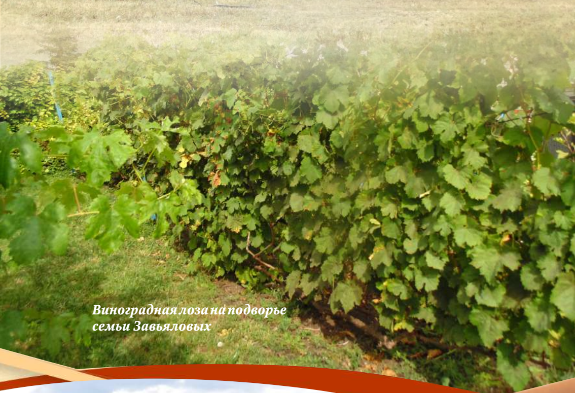
Виноградная лоза на подворье семьи Завьяловых