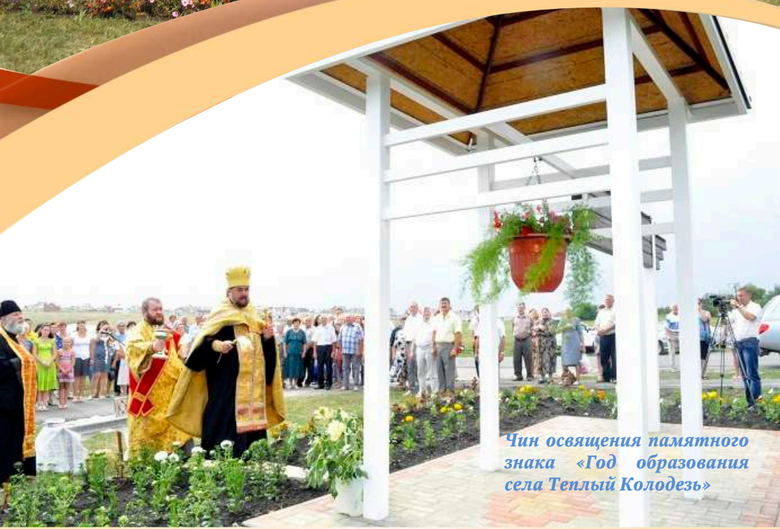
Чин освящения памятного знака «Год образования села Теплый Колодезь»