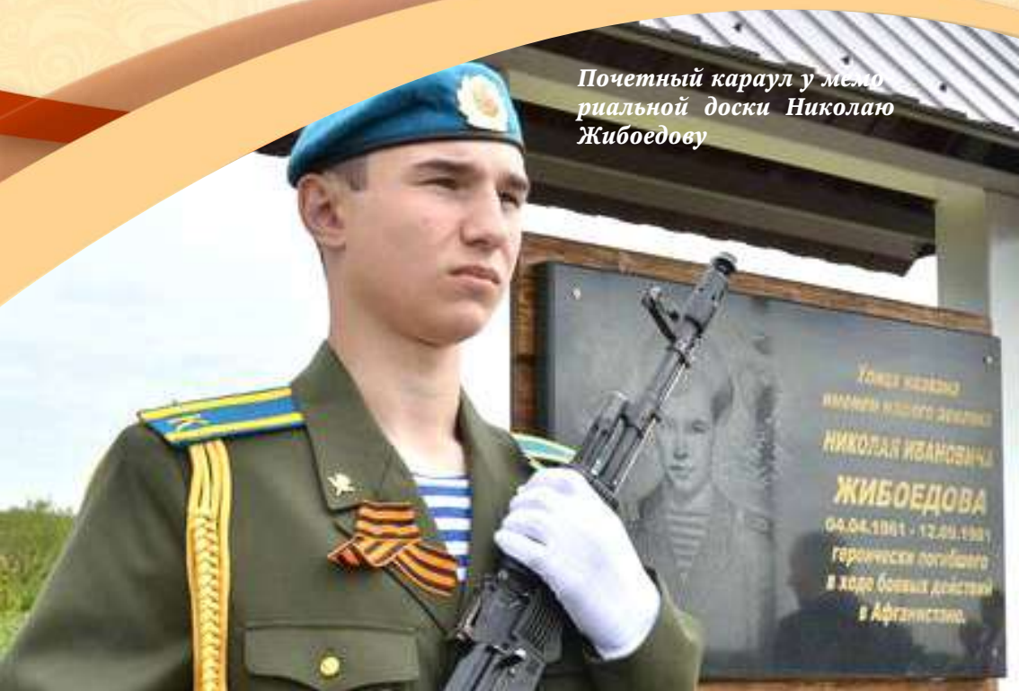
Почетный караул у мемориальной доске Николаю Жибоедову

12 сентября 1981 г. 20-летний парень героически погиб при обезвреживании фугаса большой мощности. Указом Президиума Верховного Совета СССР был награжден орденом Красной Звезды посмертно. В 2008 г. имя Николая Жибоедова было присвоено одной из улиц села Теплый Колодезь.