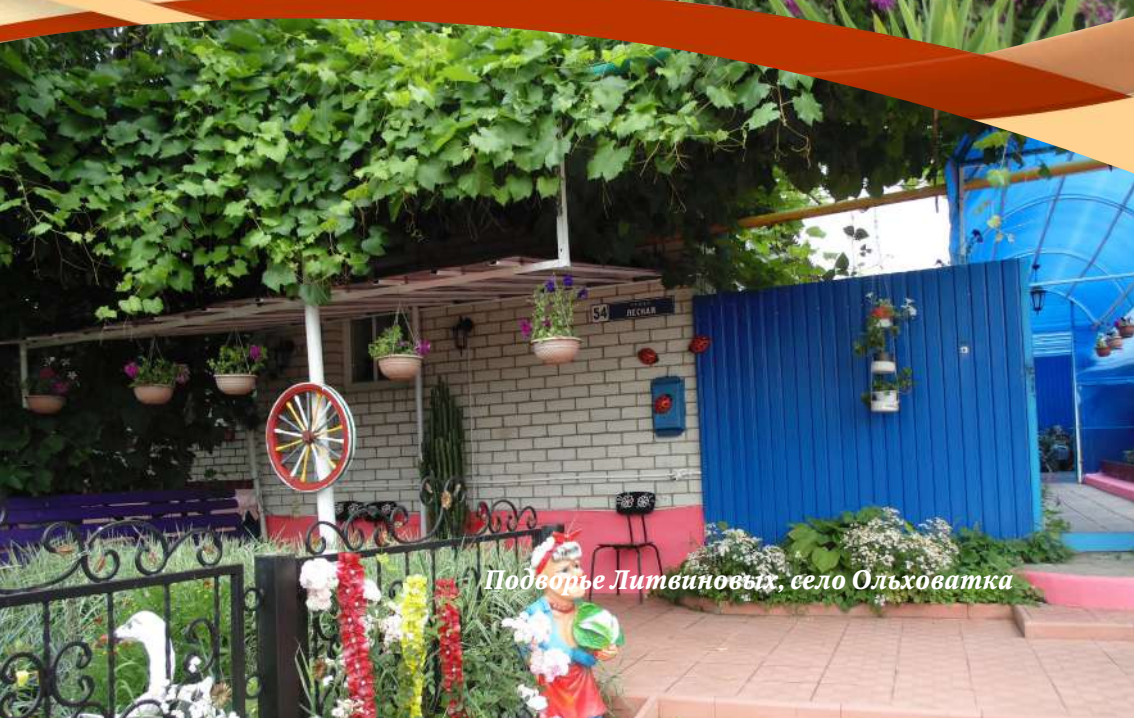
Подворье Литвиновых, село Ольховатка