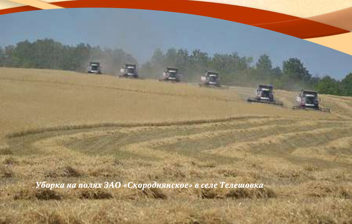
Уборка на полях ЗАО «Скороднянское» в селе Телешовка

В хозяйстве привыкли бережно относиться к технике, рационально организуют труд комбайнеров. Поэтому уборку здесь проводят в кратчайшие сроки, хотя специфика универсального полеводческого и животноводческого хозяйства требует дополнительных затрат на сбор соломы. Зато все зерно хозяйство оставляет у себя, сводя к минимуму транспортные расходы и рыночные риски.