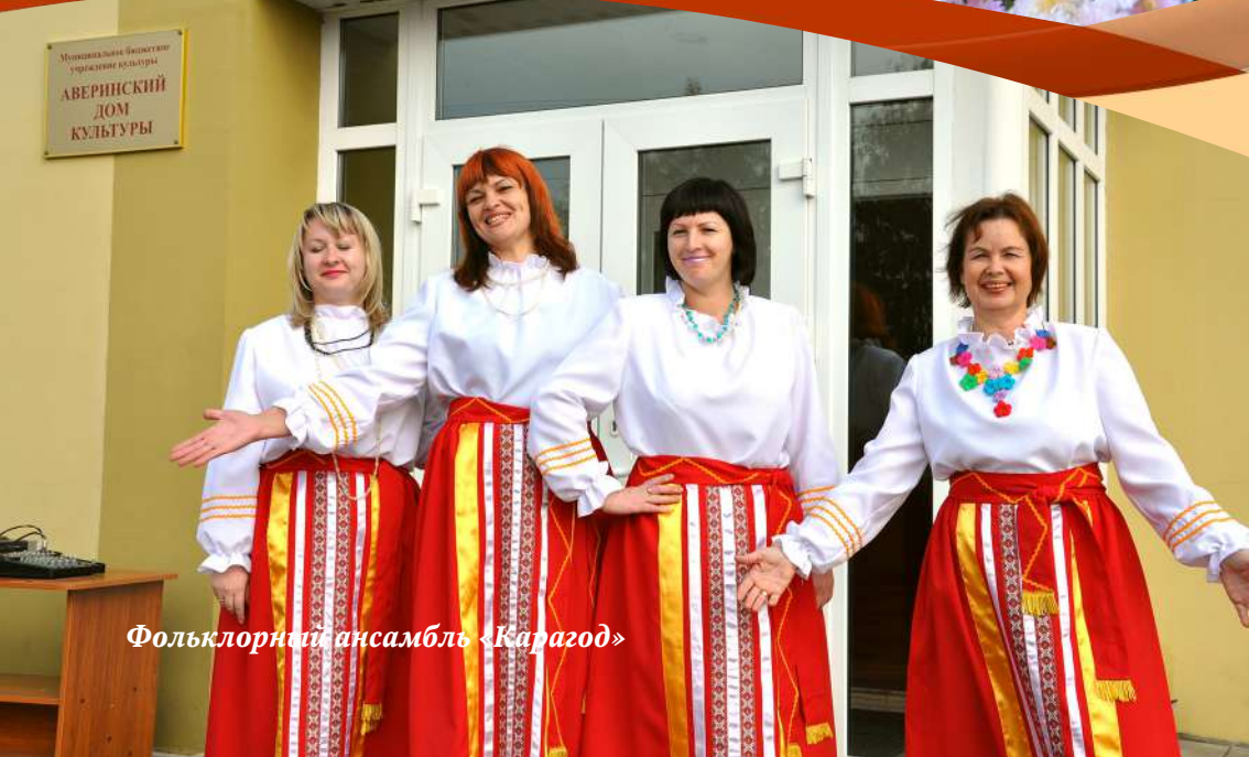
Фольклорный ансамбль «Карагод»