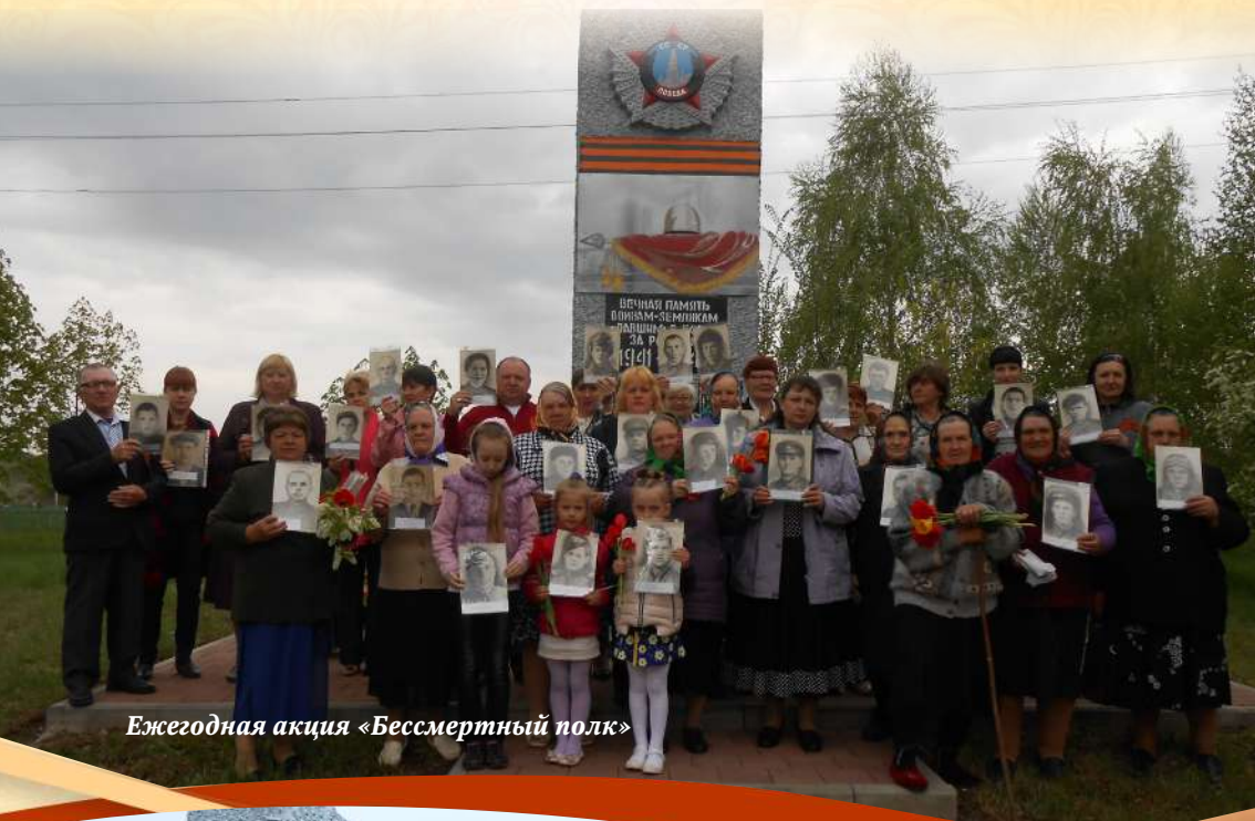
Ежегодная акция «Бессмертный полк»

Во время Великой Отечественной войны с территории сельского Совета мобилизовано на фронт 666 человек, погибли 310, из них пропали без вести 198 человек.