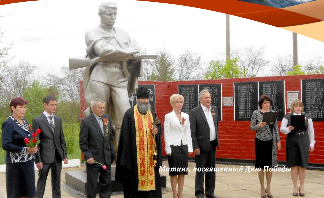
Митинг, посвященный Дню Победы