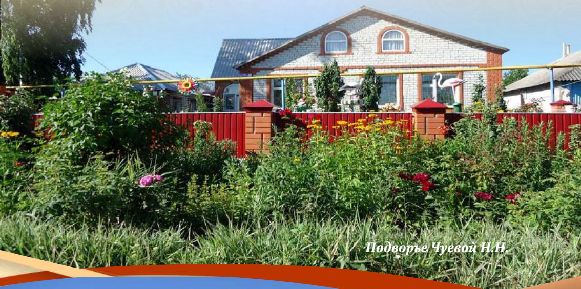
Подворье Чуевой Н.Н.