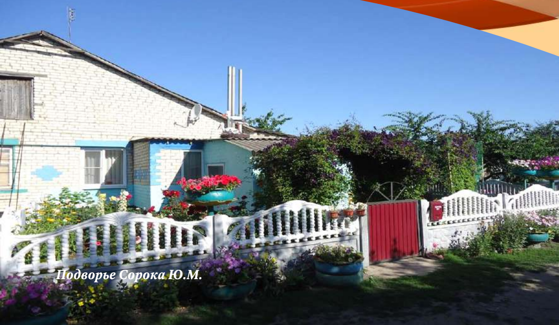
Подворье Сорока Ю.М.