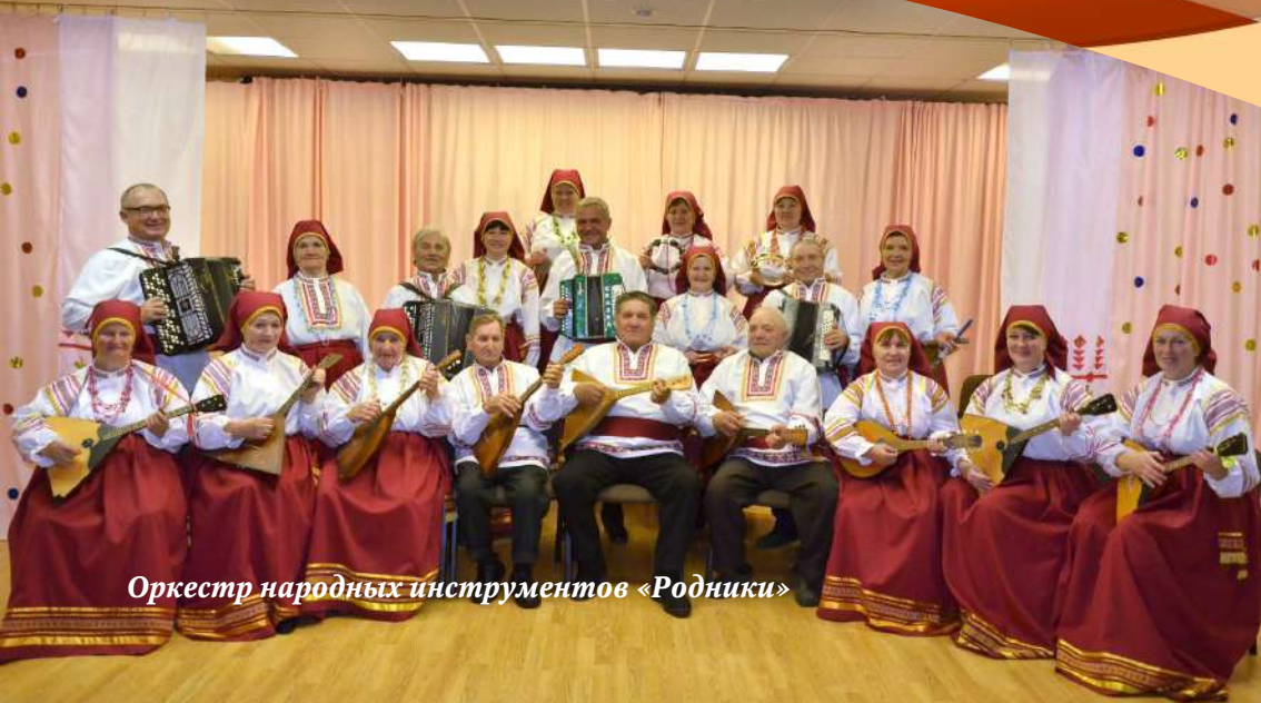
Оркестр народных инструментов «Родники»