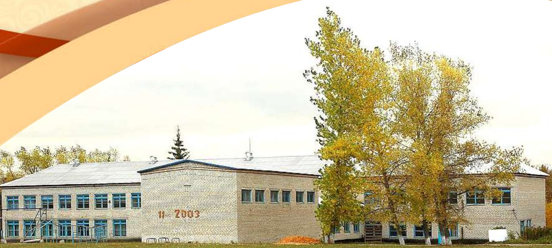
Первое здание школы, построенное в 1973 году