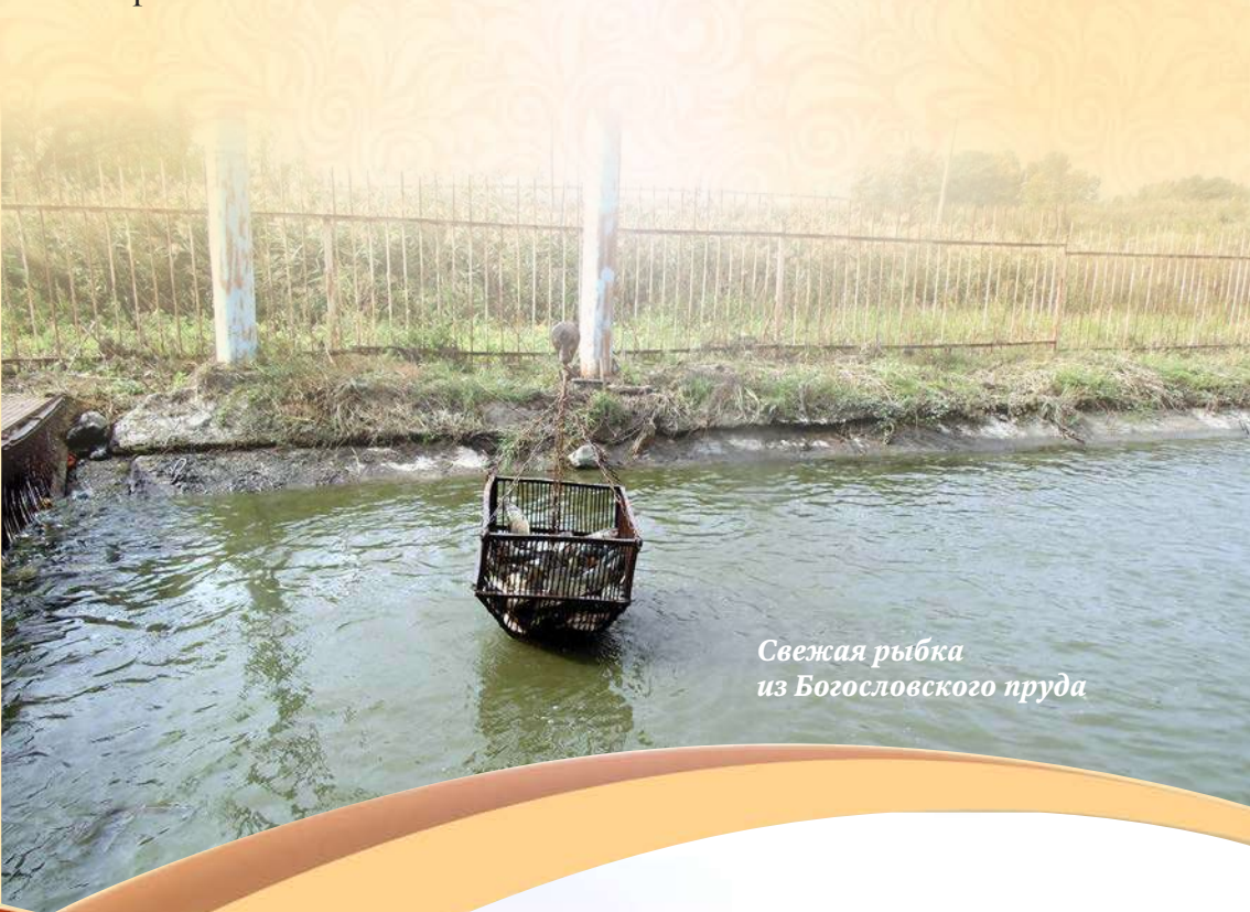
Свежая рыбка из Богословского пруда

Одной из достопримечательностей села Богословка является живописный пруд, где располагается ЧП «Оникиенко» по производству товарной рыбы. Это предприятие специализируется на разведении карповых видов рыбы, обеспечивая при этом население всего Центрального Черноземья, свежей рыбой.