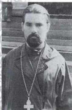
Первые годы служения.