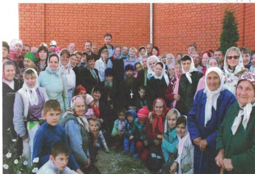
Праздник Рождество Пресвятой Богородицы. с. Успенка