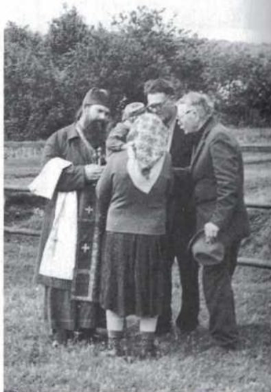
На кладбище Морозов хутор.