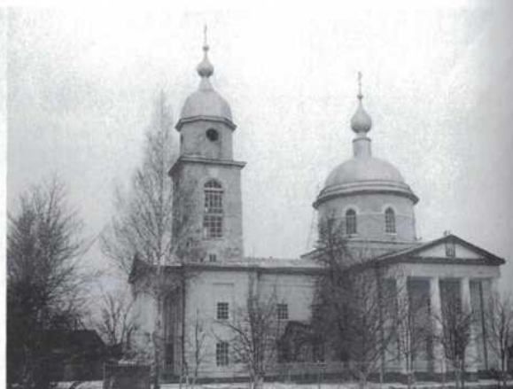
Храм в 2000 г.